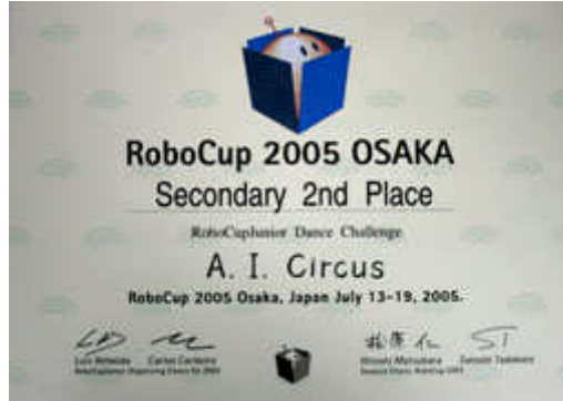
恭賀『D07 (A.I. Circus)』在 2005 青少年機械人世界盃大賽中學舞蹈組中勇奪世界亞軍殊榮，為港增光。